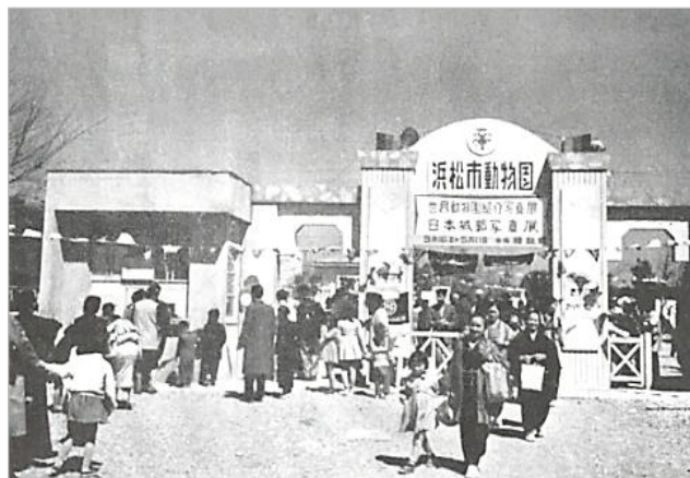
浜松市動物園の正門前広場

■浜松市動物園：昭和25年11月に「浜松こども博覧会」跡地に静岡県内初の動物園が開園。現在、「作左の森」や日本庭園がある場所。