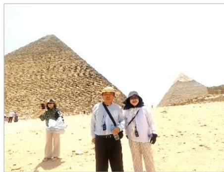
ピラミッドの前で

旅行への興味を持つことはボケ防止にもなるそうです。退職(帰国)して約10年、便利で安全で清潔な日本で、のんびり生きて来ましたが、久々の海外旅行を体験してみても、「自分から活力がスッカリ無くなった。まずいな。」と思い直しました。今後も旅行する機会を作って活力ある自分を取り戻したいと思います。